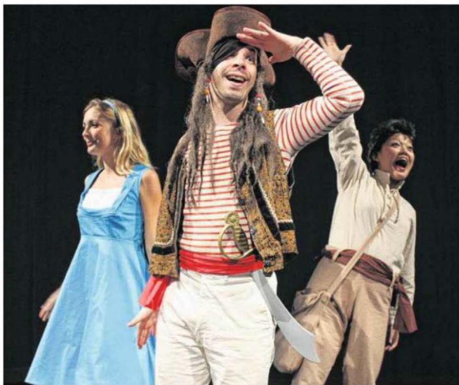
Fort Bien Très Loin met en scène plusieurs personnages connus de nos contes.